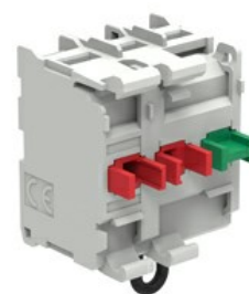
Zestyki – bez adaptera montażowego LPXC