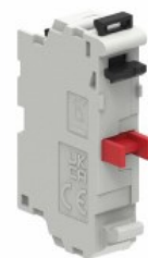
Zestyki – bez adaptera montażowego LPXC