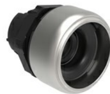
Przycisk osłonięty, samoczynny powrót, bez zatyczki LPXB3