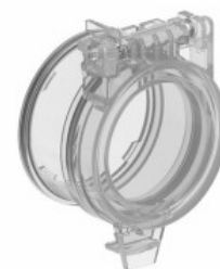
Osłona ochronna do interfejsu komunikacji LPCD... Ø22mm/ 5 0.015 0.87" LPXAU171