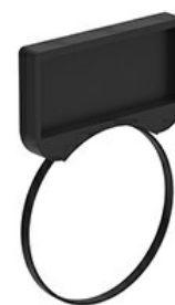
Oprawa etykiet do plastikowych etykiet LPX AU109 LPXAU100