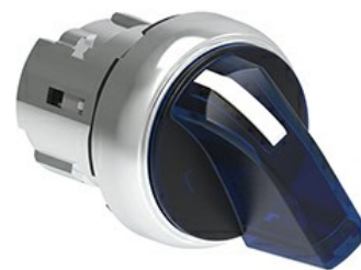
Podświetlany przełącznik - 3 pozycje LPSSL13