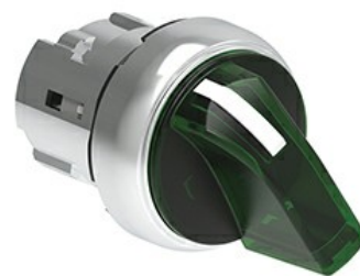
Podświetlany przełącznik - 3 pozycje LPSSL13