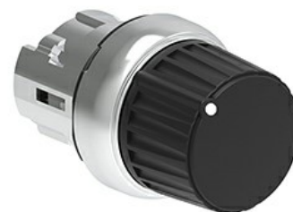
Przełącznik sterowniczy, pokrętło - 3 pozycje LPSS43