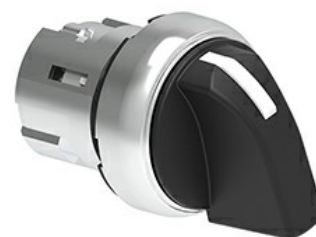
Przełącznik sterowniczy, dźwignia - 3 pozycje LPSS13