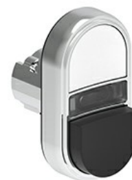
Przyciski dwuklawiszowe z samoczynnym powrotem i białym, podświetlanym wskaźnikiem – jeden wystający i jeden kryty LPSBL72