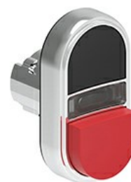
Przyciski dwuklawiszowe z samoczynnym powrotem i białym, podświetlanym wskaźnikiem – jeden wystający i jeden kryty LPSBL72