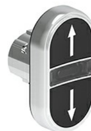
Przyciski dwuklawiszowe z samoczynnym powrotem i białym, podświetlanym wskaźnikiem – dwa kryte LPSBL71