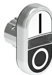
Przyciski dwuklawiszowe z samoczynnym powrotem i białym, podświetlanym wskaźnikiem – dwa kryte LPSBL71