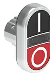
Przyciski dwuklawiszowe z samoczynnym powrotem i białym, podświetlanym wskaźnikiem – dwa kryte LPSBL71