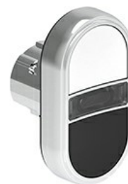
Przyciski dwuklawiszowe z samoczynnym powrotem i białym, podświetlanym wskaźnikiem – dwa kryte LPSBL71