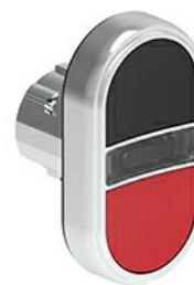
Przyciski dwuklawiszowe z samoczynnym powrotem i białym, podświetlanym wskaźnikiem – dwa kryte LPSBL71