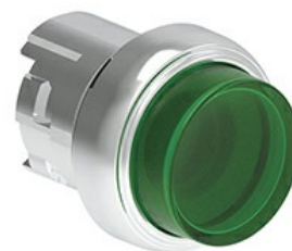
Przyciski podświetlane, samoczynny powrót - wystające LPSBL20