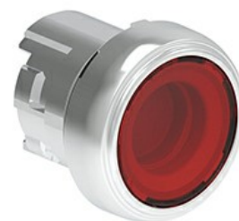
Przyciski podświetlane, samoczynny powrót - kryte LPSBL10