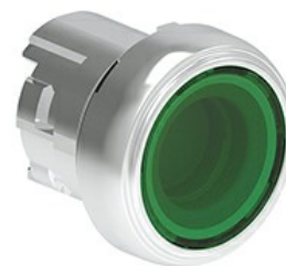
Przyciski podświetlane, samoczynny powrót - kryte LPSBL10