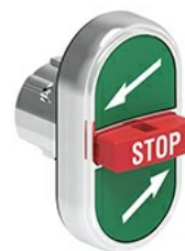
Przyciski trzyklawiszowe, samoczynny powrót - środkowy wystający LPSB73