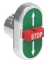
Przyciski trzyklawiszowe, samoczynny powrót - środkowy wystający LPSB73