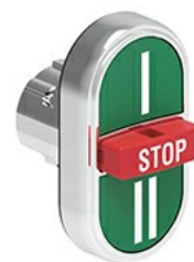
Przyciski trzyklawiszowe, samoczynny powrót - środkowy wystający LPSB73