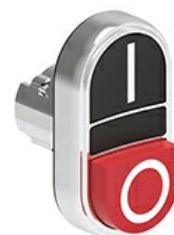
Przyciski dwuklawiszowe z samoczynnym powrotem – jeden wystający i jeden kryty LPSB72