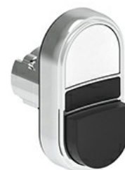
Przyciski dwuklawiszowe z samoczynnym powrotem – jeden wystający i jeden kryty LPSB72