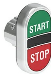
Przyciski dwuklawiszowe z samoczynnym powrotem – dwa kryte LPSB71