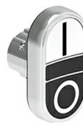
Przyciski dwuklawiszowe z samoczynnym powrotem – dwa kryte LPSB71