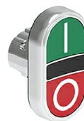
Przyciski dwuklawiszowe z samoczynnym powrotem – dwa kryte LPSB71