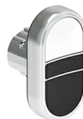
Przyciski dwuklawiszowe z samoczynnym powrotem – dwa kryte LPSB71