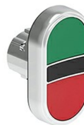
Przyciski dwuklawiszowe z samoczynnym powrotem – dwa kryte LPSB71