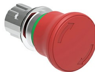
Przycisk do zatrzymania awaryjnego (grzybki), blokowany, odblokowanie przez obrót Ø 40 mm/1,6" LPSB664