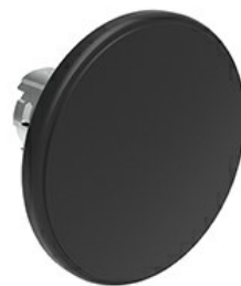
Przycisk do zatrzymania awaryjnego (grzybek), samoczynny powrót, Ø 60mm/2.36" LPSB614