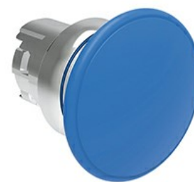
Przycisk do zatrzymania awaryjnego (grzybek), samoczynny powrót, Ø 40 mm/1,6" LPSB614