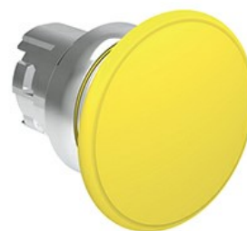
Przycisk do zatrzymania awaryjnego (grzybek), samoczynny powrót, Ø 40 mm/1,6" LPSB614