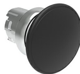
Przycisk do zatrzymania awaryjnego (grzybek), samoczynny powrót, Ø 40 mm/1,6" LPSB614