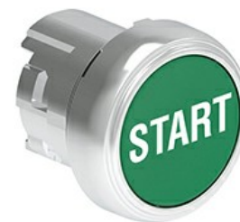
Przyciski, samoczynny powrót, z symbolem LPSB11