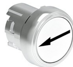
Przyciski, samoczynny powrót, z symbolem LPSB11