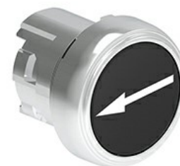
Przyciski, samoczynny powrót, z symbolem LPSB11