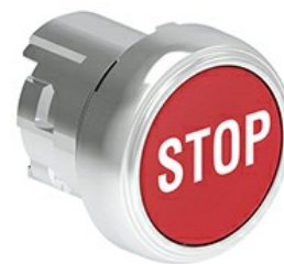
Przyciski, samoczynny powrót, z symbolem LPSB11