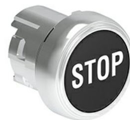
Przyciski, samoczynny powrót, z symbolem LPSB11