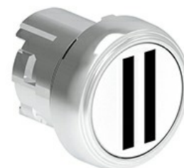
Przyciski, samoczynny powrót, z symbolem LPSB11