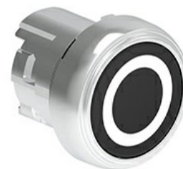
Przyciski, samoczynny powrót, z symbolem LPSB11