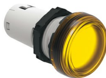
Jednoczęściowa lampka LED, światło ciągłe LPML