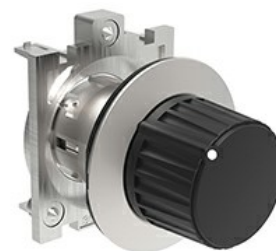
Przełącznik sterowniczy, pokrętło - 3 pozycje LPFS43