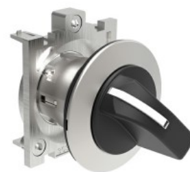
Przełącznik sterowniczy, dźwignia - 3 pozycje LPFS13