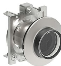
Przyciski podświetlane, samoczynny powrót - wystające LPFBL20