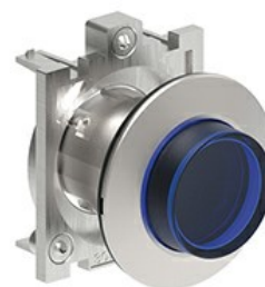
Przyciski podświetlane, samoczynny powrót - wystające LPFBL20