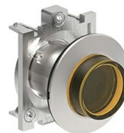
Przyciski podświetlane, samoczynny powrót - wystające LPFBL20