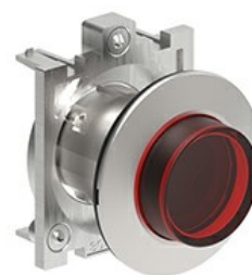
Przyciski podświetlane, samoczynny powrót - wystające LPFBL20