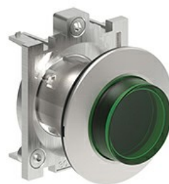
Przyciski podświetlane, samoczynny powrót - wystające LPFBL20