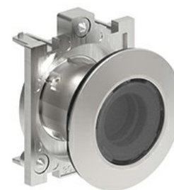
Przyciski podświetlane, samoczynny powrót - kryte LPFBL10